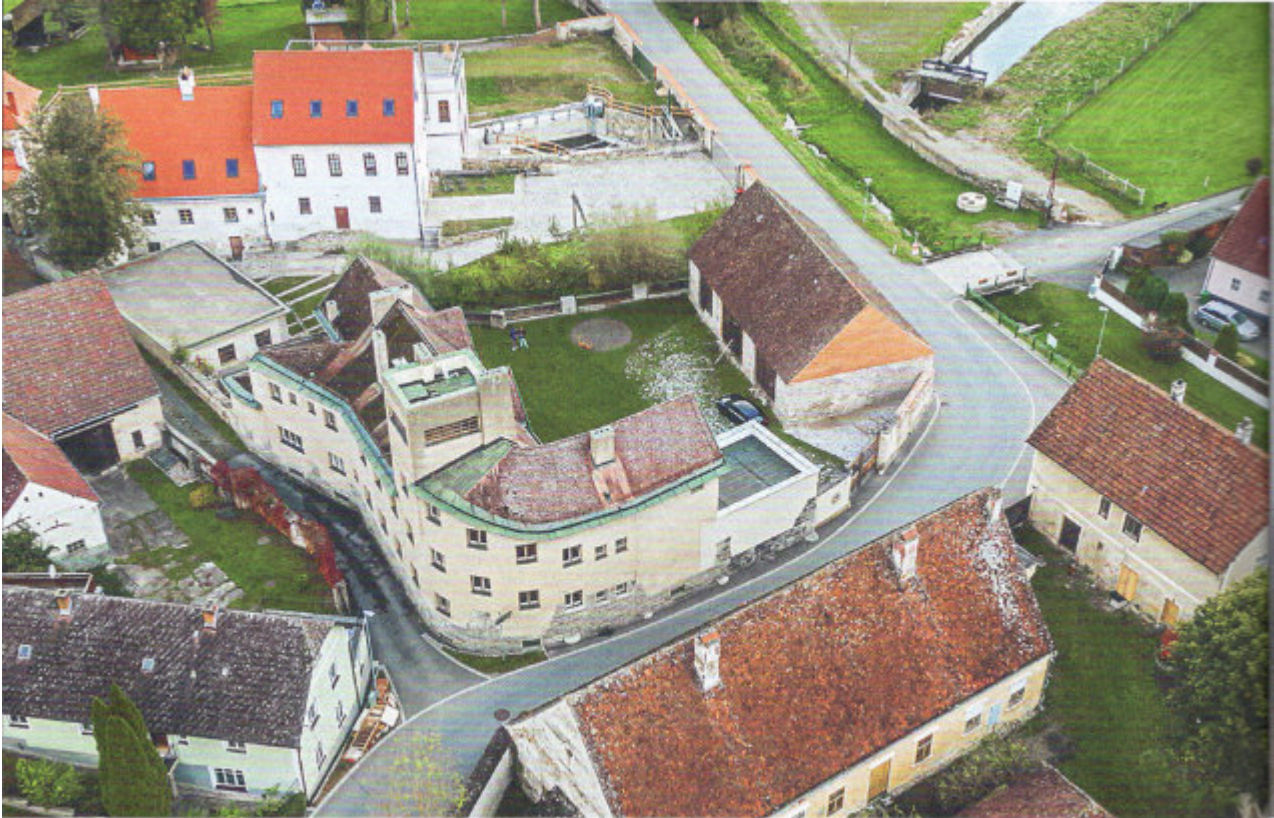
Die Villa wurde minutiös in die engen Gassen des kleinen Dorfes eingepasst.