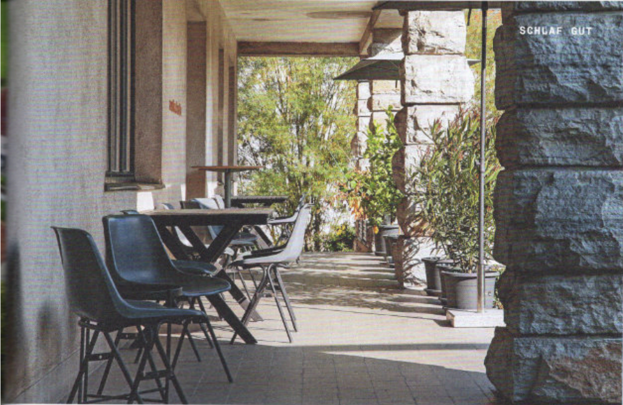
Auf der langgezogenen Terrasse lässt es sich herrlich mit der Seele baumeln.

Die Vorderseite schaut ganz anders aus, mit einem mächtigen Holztor, durch das man in den eingefriedeten Garten gelangt, mit einer grünen Wiese, einer langgezogenen, überdachten Terrasse und, vor allem, mit einem Haus, das sich mit vielfältigen Balkonen und Terrassen zu diesem Garten hin öffnet.